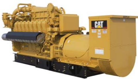
Генераторная установка показана с оборудованием, устанавливаемым по специальному заказу